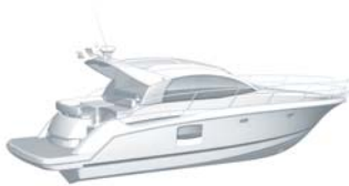
P 42 S

Inventaire de la Prestige 60 sur document spécifique Inventory on specific Prestige 60 annex