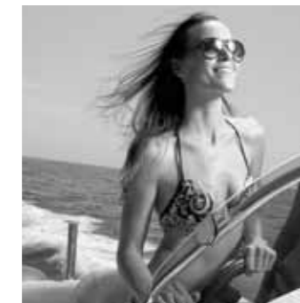
Shows the 2011 Style version / Représente la série Style 2011

Fast and intense. The product of 30 successful years, the Cap Camarat 7.5 CC is a boat for boat lovers. They'll love the aggressive design, the freedom of movement created by a clever use of space, and the performance and comfort of a proven hull. For anglers, there's a fishing console, live catch storage and generous console stowage space. Something for everyone!