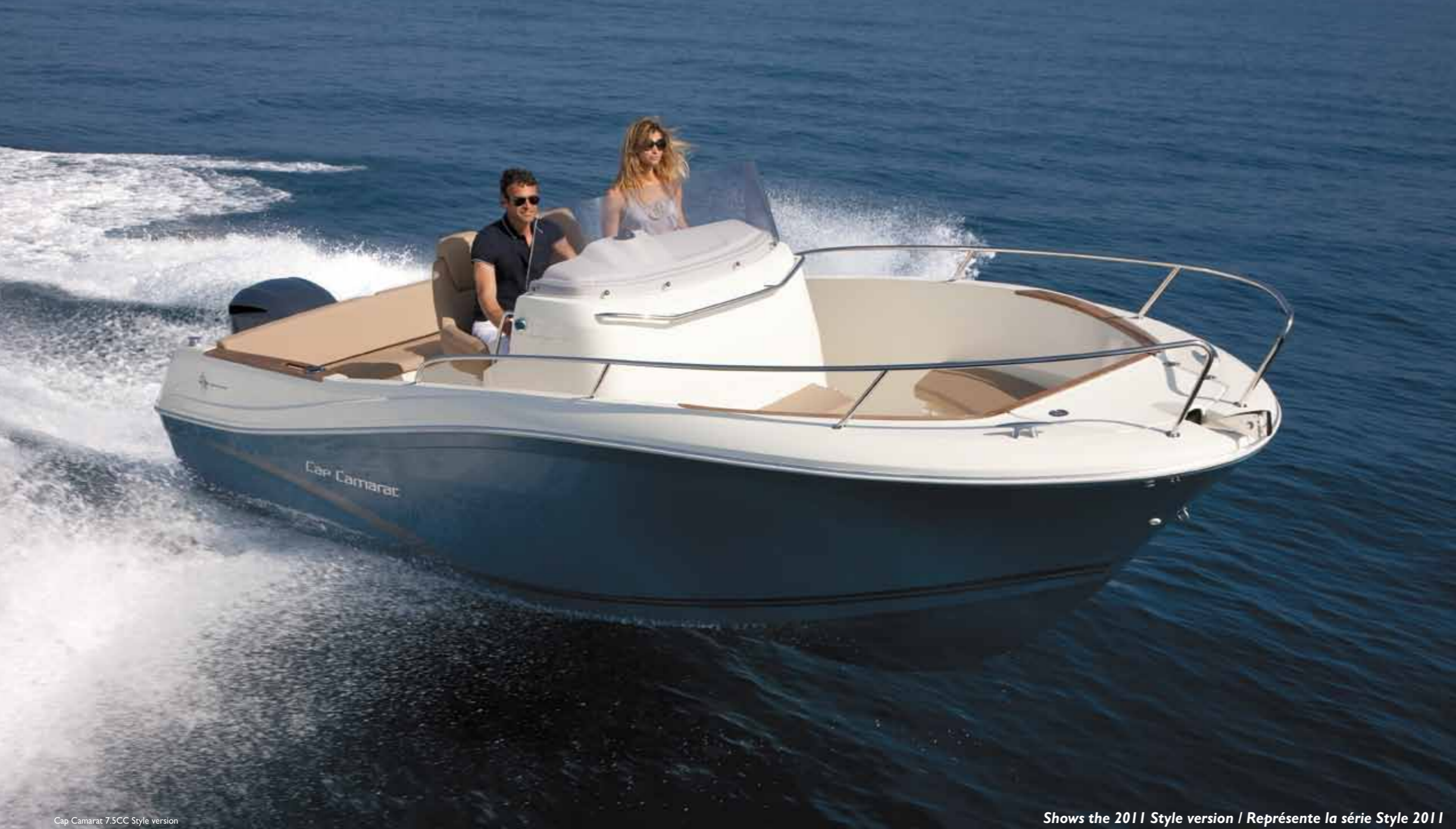
Cap Camarat 7.5CC Style version