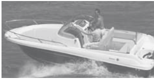
Cap Camarat 6.5 WA