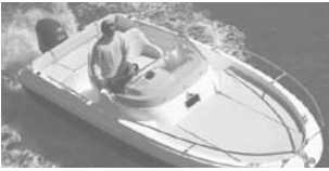
Cap Camarat 5.5 WA