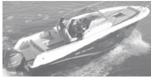
Cap Camarat 7.5 WA