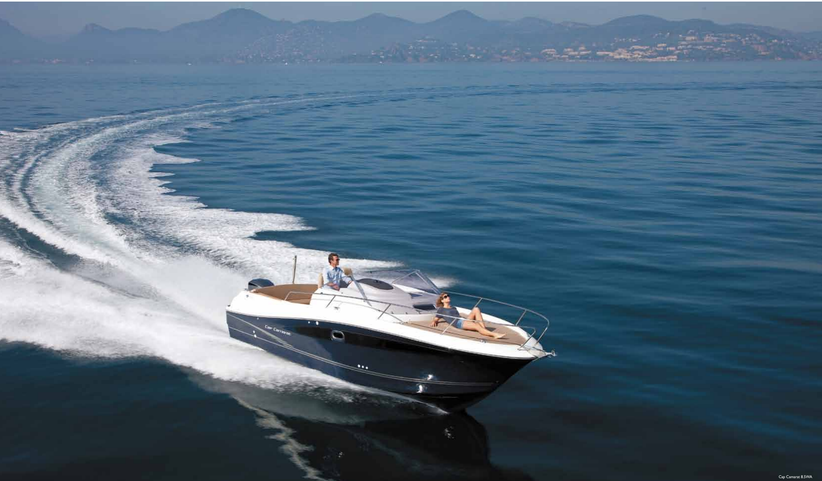
Cap Camarat 8.5WA