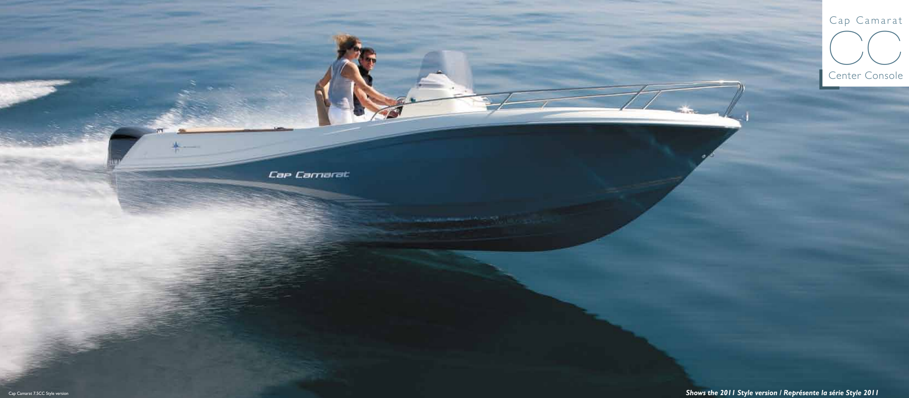
Cap Camarat 7.5CC Style version