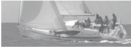
Sun Odyssey 45 DS